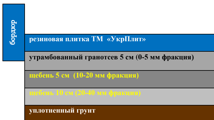
Рис.3 – Подготовка основания для укладки резиновой плитки на ПГС: