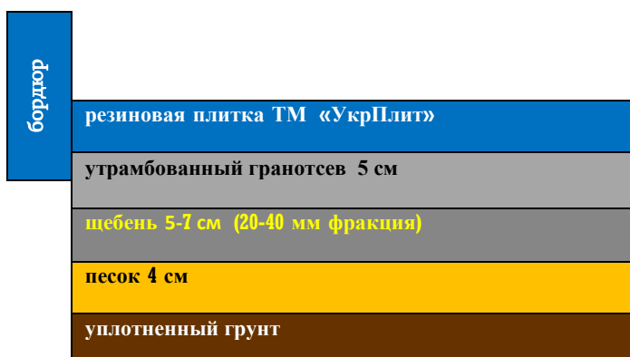
Рис.3 – Подготовка основания для укладки резиновой плитки на ПГС: